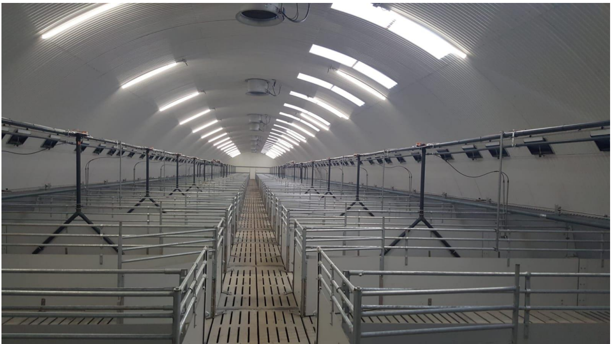
Hala porc gras