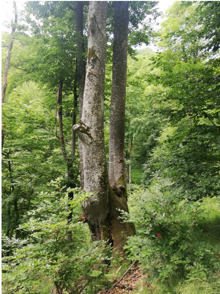
Foto 6 Arbore biodiversitate habitat 9150