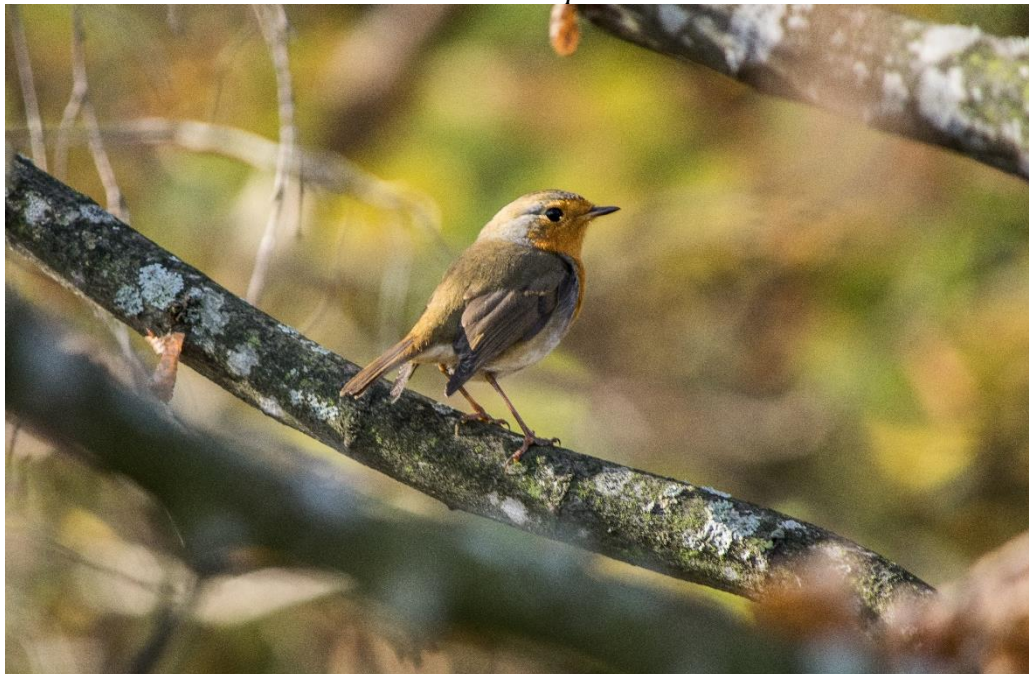
Foto 5 Erithacu rubetra