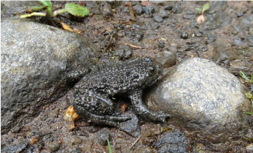
Foto 3 Exemplar Bombina variegata în habitat de pe drum forestier