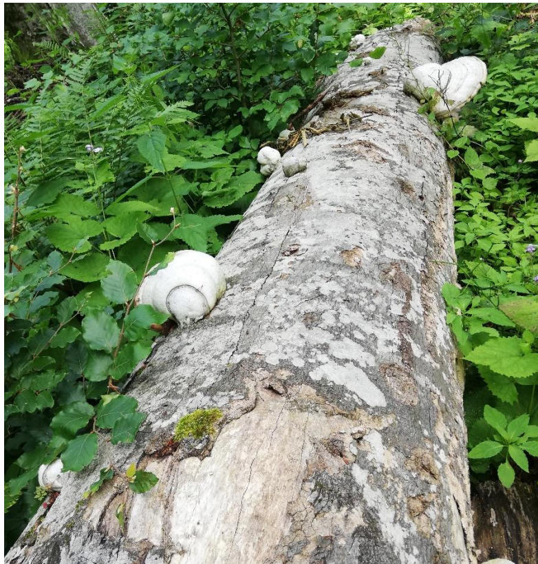
Foto 7 Lemn mort habitat 9130