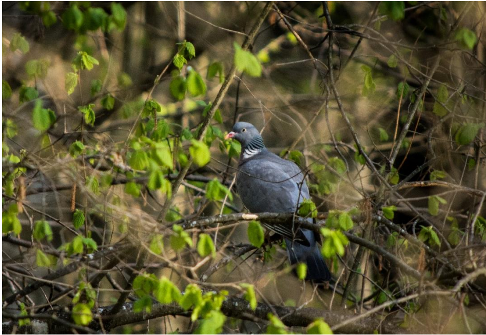
Foto 4 Columba palumbus