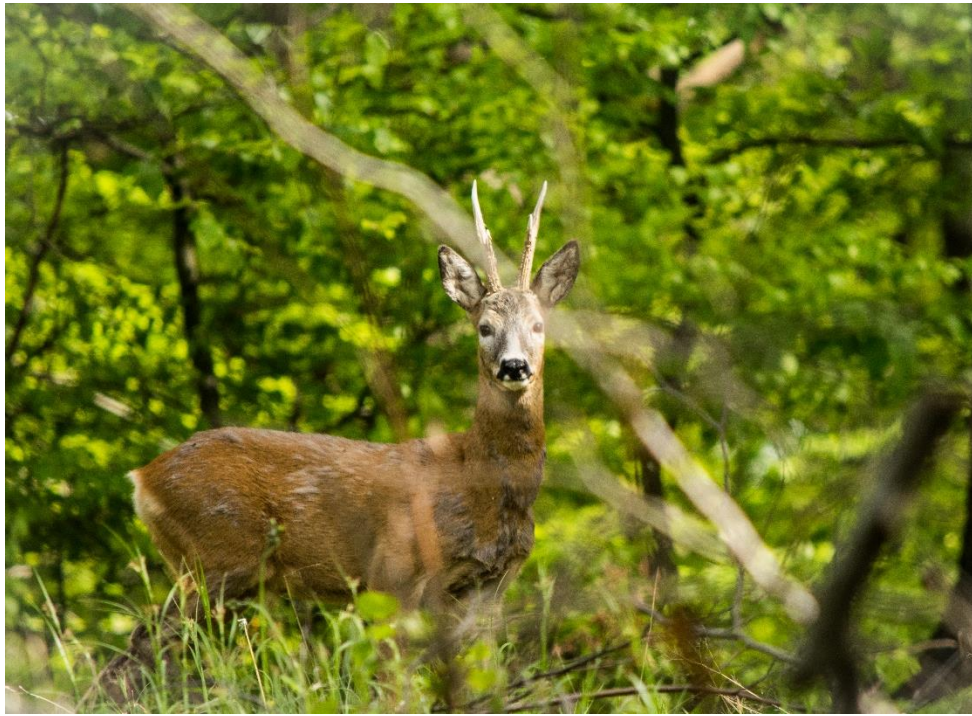
Foto 2 Exemplar de Capreolus capreolus