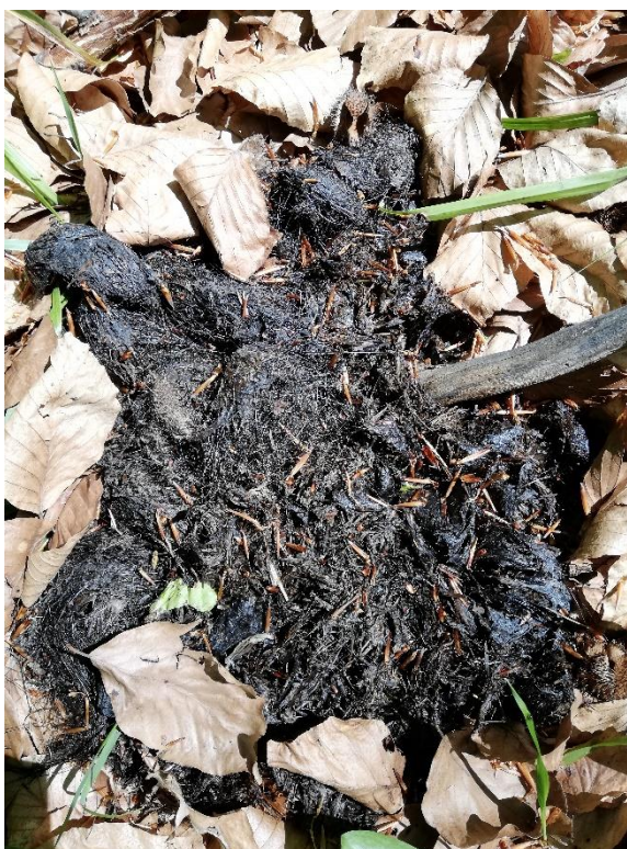
Foto 1 Excrement Ursus arctos

În continuare vor fi prezentate un set de fotografii realizate în timpul deplasărilor efectuate pe suprafața amenajamentului silvic.