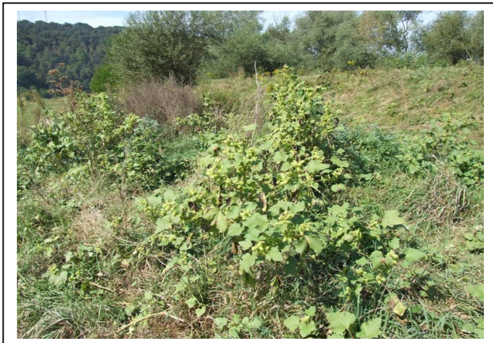
Figura V.5. Cornuți ( Xanthium italicum )

Cornuți ( Xanthium italicum ) O altă specie străină invazivă o reprezintă cornuții plantă dicotiledonată anuală, originară din America Centrală și de Sud. Se dezvoltă pe terenurile agricole abandonate, la marginea culturilor, dar și în habitate naturale și seminaturale. Preferă solurile nisipoase. Tulpina înaltă (50-120 cm), dreaptă, cilindrică cu peri mici, aspri și puține ramuri. Are nervuri și pete purpurii.