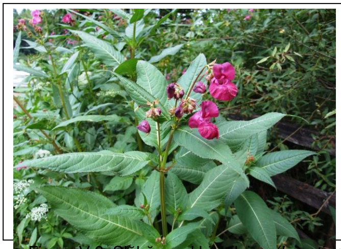
Figura V.6. Slăbănogul himalaian ( Impatiens glandulifera )

Slăbănogul himalaian ( Impatiens glandulifera ) este o plantă anuală cu tulpini de până la 2 m înălțime și flori roze sau liliachii. Apare invaziv în Transilvania, Oltenia, Muntenia, Maramureș și Moldova. Originară din Himalaia, a fost cultivată inițial ca plantă ornamentală.