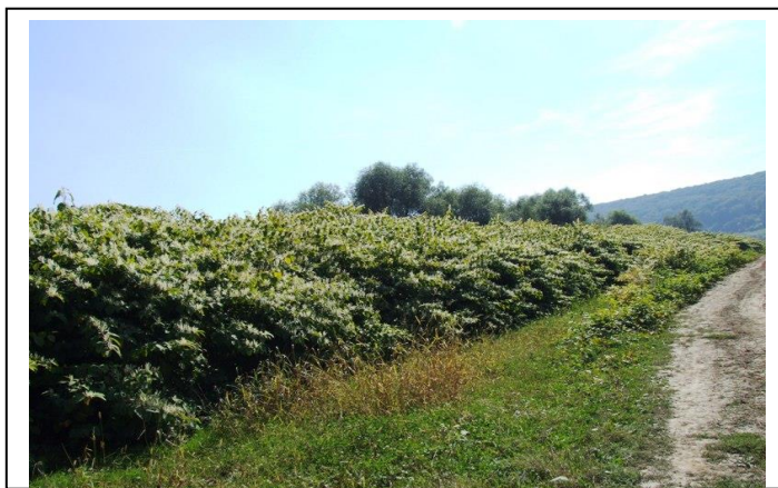
Figura V.3. Pajiște invadată de troscot mare japonez ( Reynoutria japonica )

Troscotul japonez ( Reynoutria japonica ) este o plantă perenă, originară din Japonia, inițial cultivată în scop ornamental. Atinge înălțimi de 2-3 m, fiind considerată una dintre cele mai periculoase plante invazive, cauzând probleme nu numai în Europa, ci și în Australia, Noua Zeelandă și America de Nord.