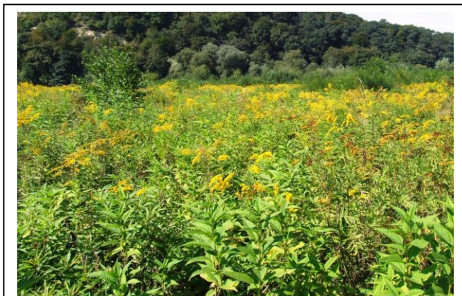
Figura V.2. Fâneță invadată de Sânziene canadiene ( Solidago canadensis )

Troscotul japonez ( Reynoutria japonica ) este o plantă perenă, originară din Japonia, inițial cultivată în scop ornamental. Atinge înălțimi de 2-3 m, fiind considerată una dintre cele mai periculoase plante invazive, cauzând probleme nu numai în Europa, ci și în Australia, Noua Zeelandă și America de Nord.