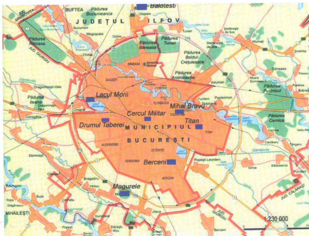
Amplasarea stațiilor de monitorizare

Prezentăm mai jos evoluția indicelui general pentru calitatea aerului din rețeaua locală de monitorizare a calității aerului