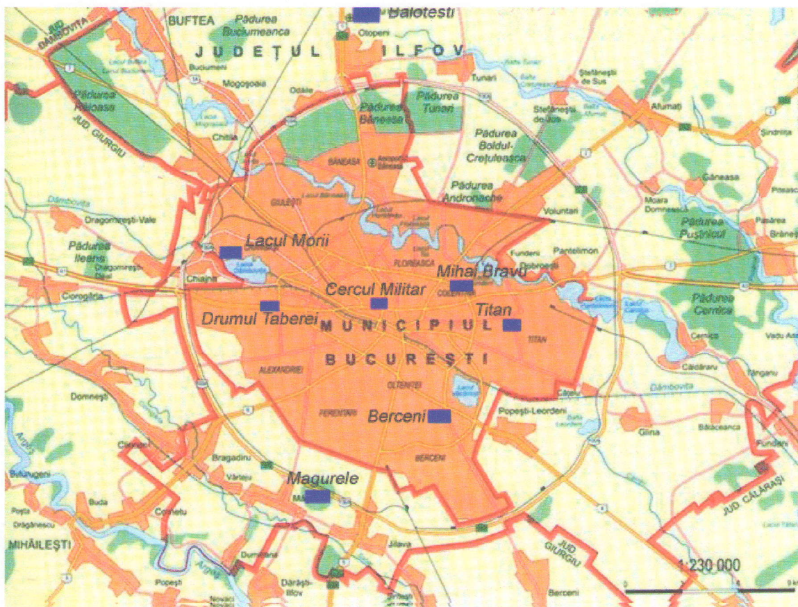
Amplasarea stațiilor de monitorizare

Prezentăm mai jos evoluția indicelui general pentru calitatea aerului din rețeaua locală de monitorizare a calității aerului