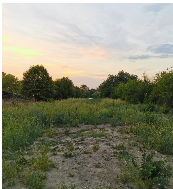
Imagine cu latura vestica a terenului studiat