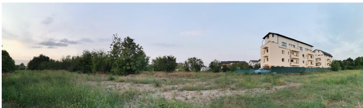
Imagine cu latura nordica a terenului studiat

Conform Certificatului de Urbanism nr. 1278/190/C/70837 din 12.12.2023, emis de Primăria Sectorului 1, categoria de folosință este curți- construcții.