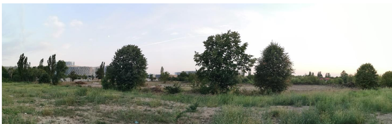
Imagine cu latura sudica a terenului studiat