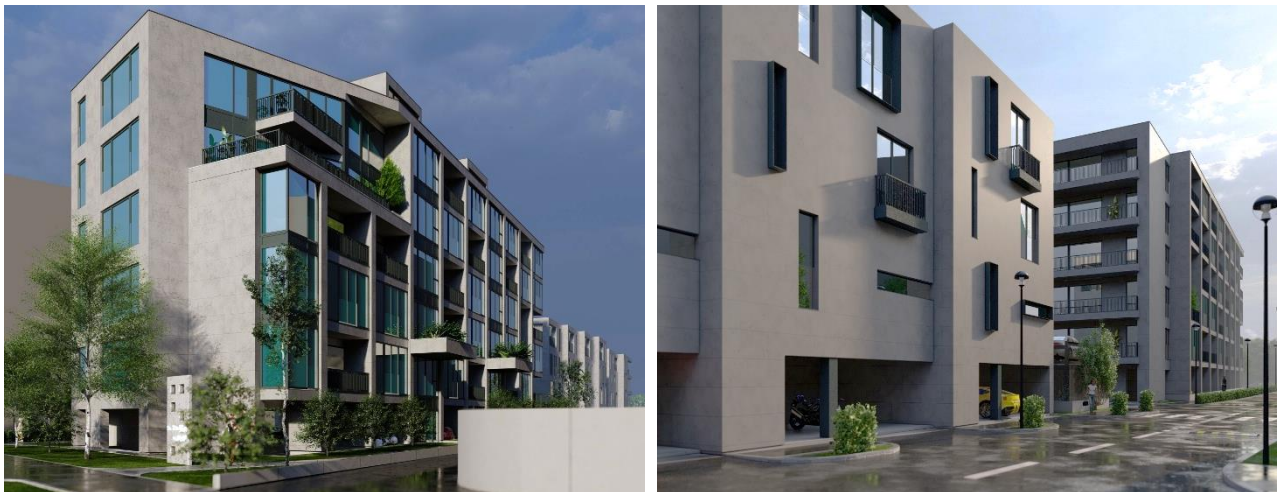
Imagini fotorealiste cu cladirile propuse pe terenul studiat