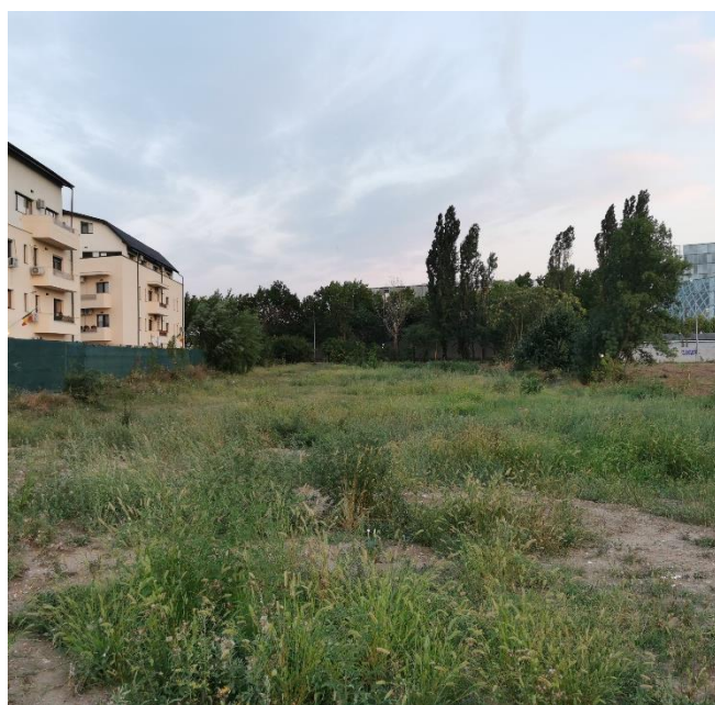
Imagine cu latura estica a terenului studiat