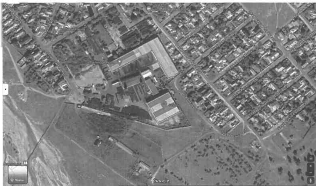
Amplasarea locației de implementare

e) planșe reprezentând limitele amplasamentului proiectului, inclusiv orice suprafață de teren solicitată pentru a fi folosită temporar (planuri de situație și amplasamente);