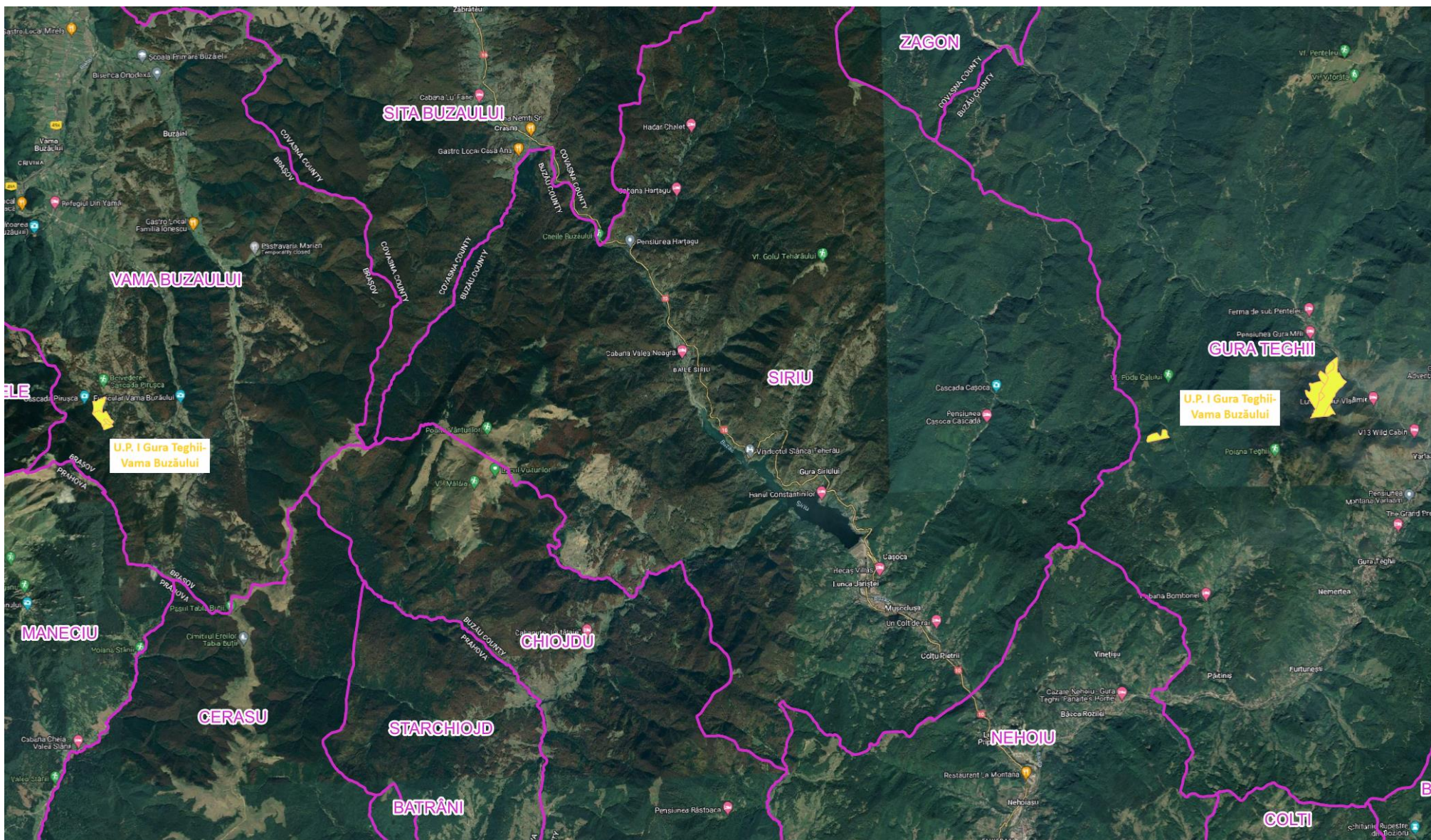
Figură 1: Localizarea U.P. I Gura Teghii-Vama Buzăului