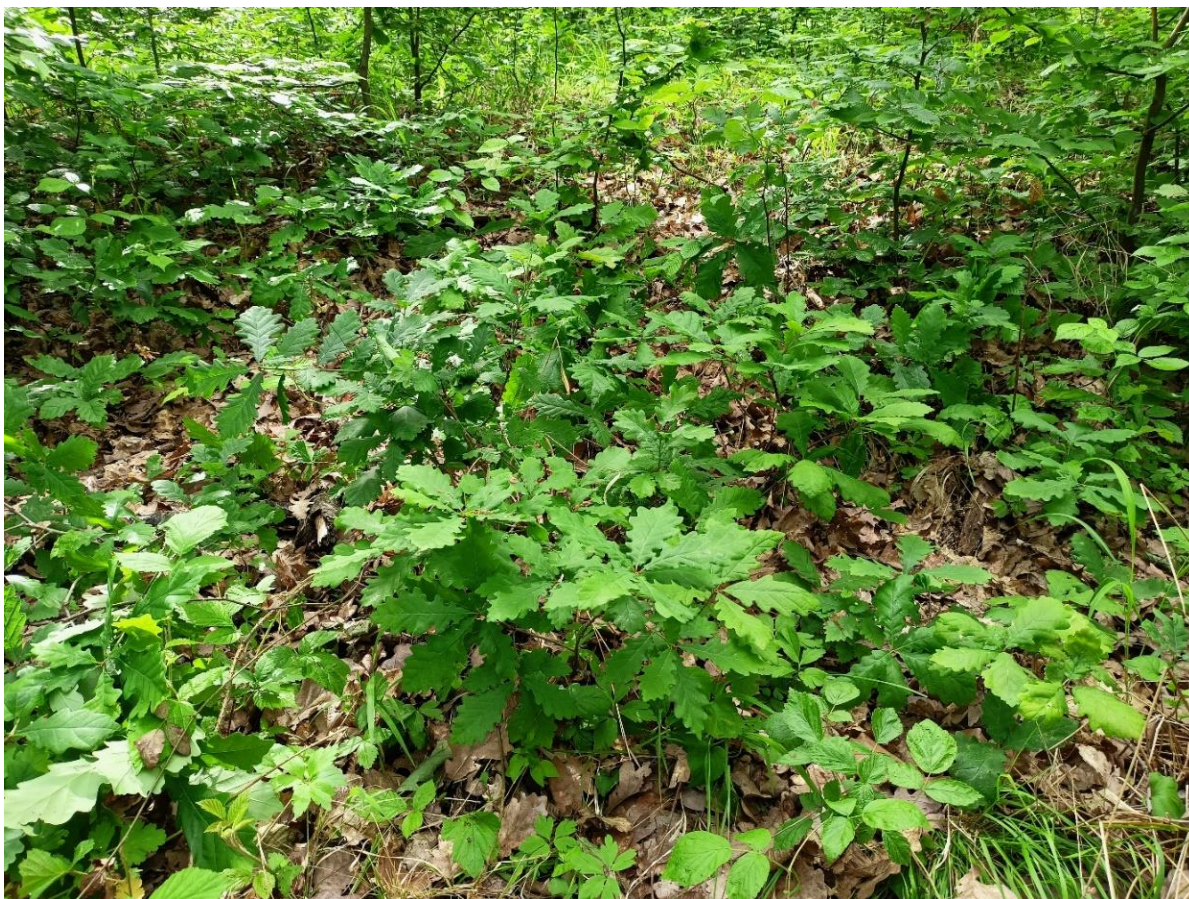
Foto 3.– Regenerare de GO în u.a 10A, după tăieri progresive de punere în lumină ( 2021)