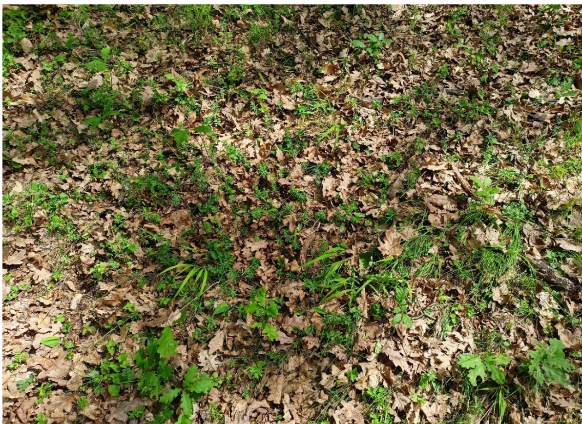
Foto 6.- Regenerare cu GO în u.a 13A, în suprafața neparcursă cu tăieri progresive