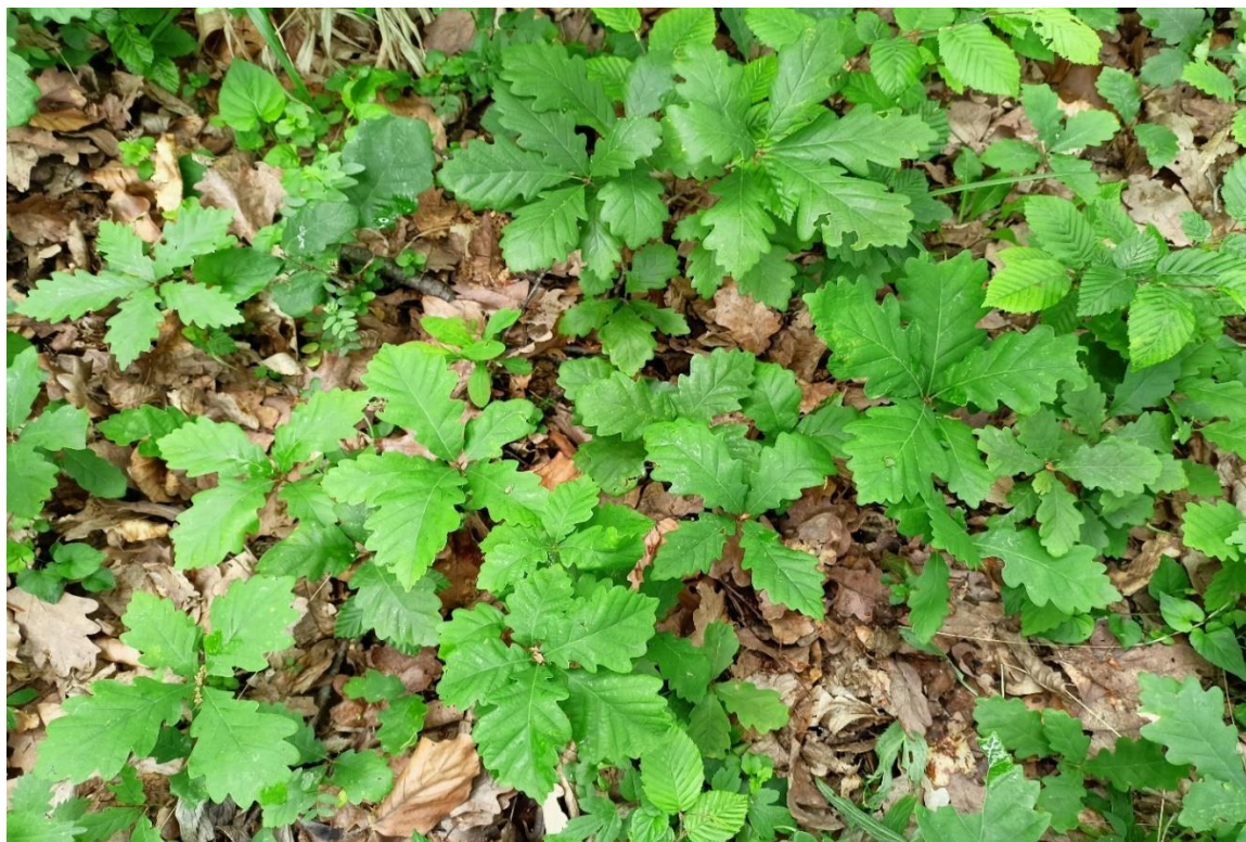
Foto 1.– Regenerare de GO în u.a 10A, după tăieri progresive de punere în lumină ( 2021)