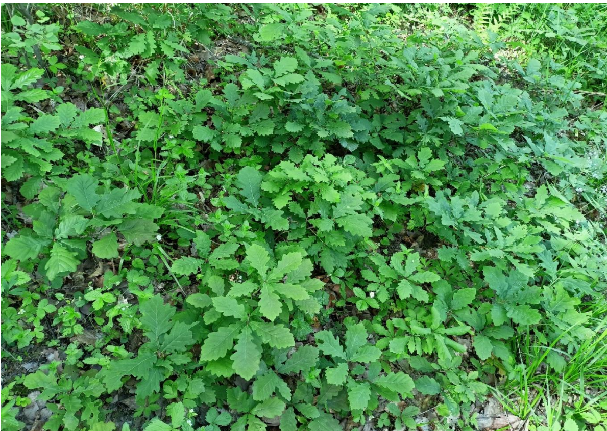
Foto 4. – Regenerare de GO în u.a. 11A, după tăieri progresive de punere în lumină (2018)