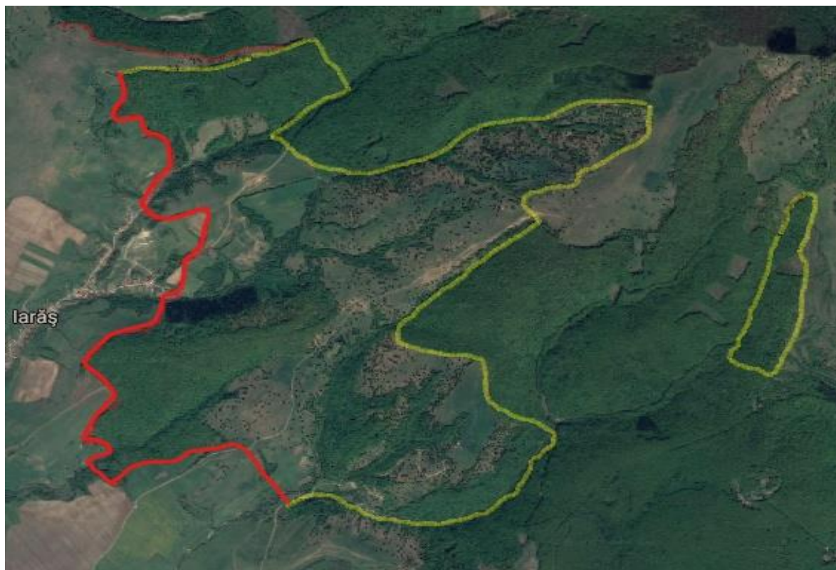
Fig. 1. Aria de extindere a U.P. VII Hăghig

Pădurile din PP, fiind cuprinse în U.P. VII Hăghig, sunt, geografic, situate în Munții Baraolt, în Carpații Orientali, grupa de Curbură, Munții Scunzi ai Curburii Interne, în bazinul hidrografic ale râului Olt, fiind limitrofe, sau chiar intercalate, cu pășuni și terenuri agricole (fânețe și terenuri arabile) de pe raza U.A.T. Hăghig, unele dintre aceste terenuri fiind, de asemenea, incluse în perimetrul ariei de protecție (fig.1.).