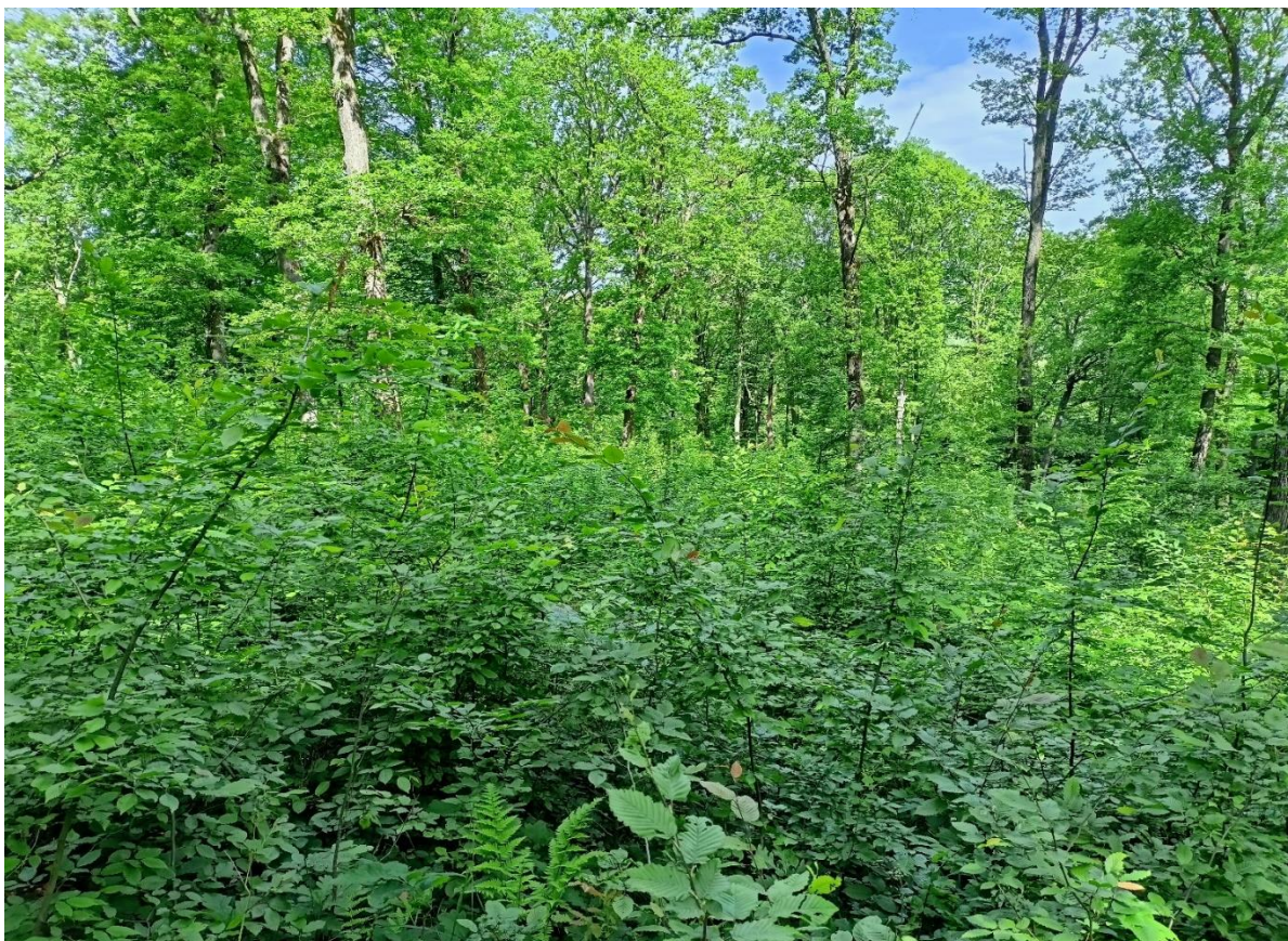
Foto 5.- Regenerare de FA și GO în u.a 11A, după tăieri progresive de însămânțare efectuate în deceniul trecut.