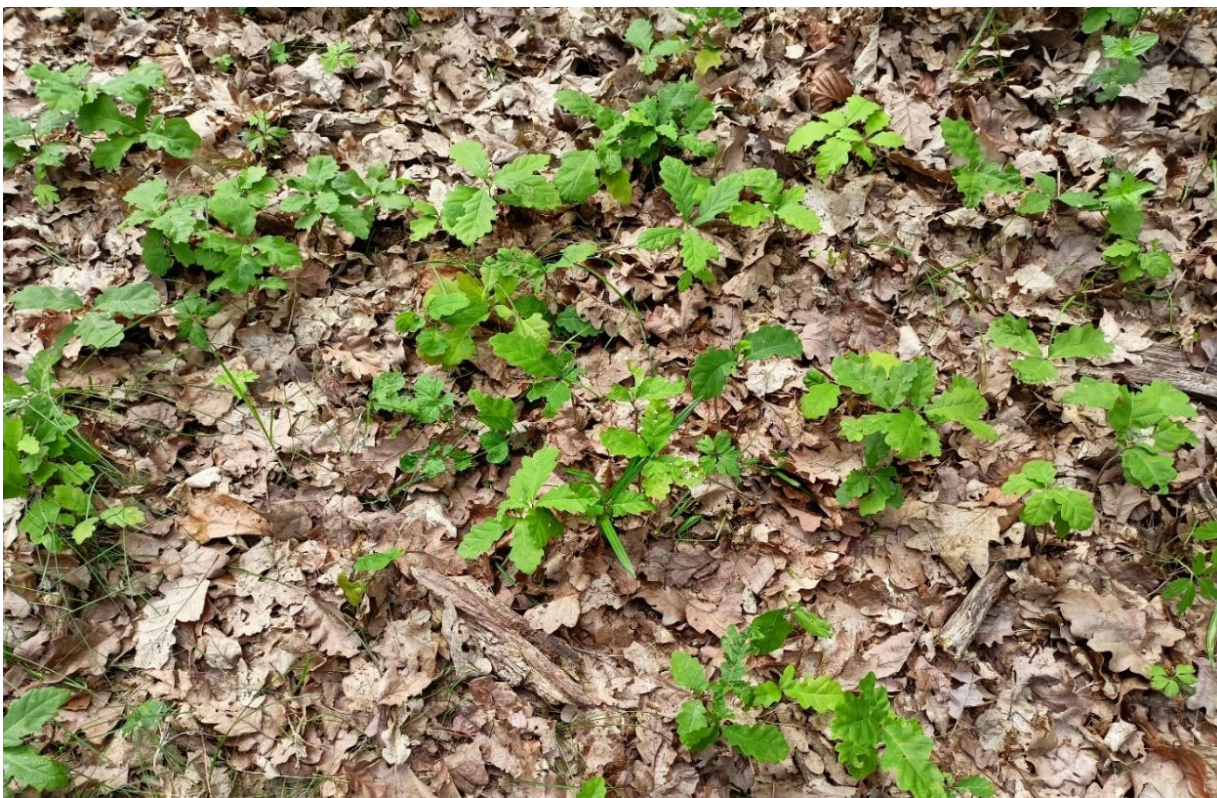
Foto 7.– Regenerare cu GO în u.a 14, în suprafața parcursă cu tăieri progresive de însămânțare (2023)