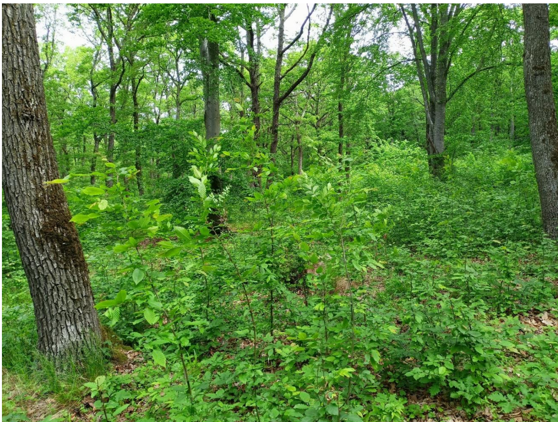
Foto 2.– Regenerare de FA și GO în u.a 10A, după tăieri progresive de însămânțare (deceniul trecut) și de punere în lumină (2021).