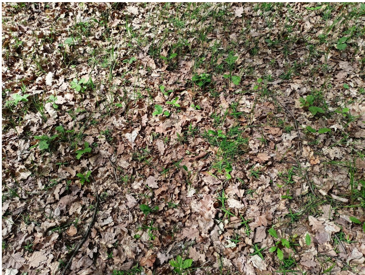
Foto 8.– Regenerare cu GO în u.a 14, în suprafața neparcursă încă cu tăieri progresive