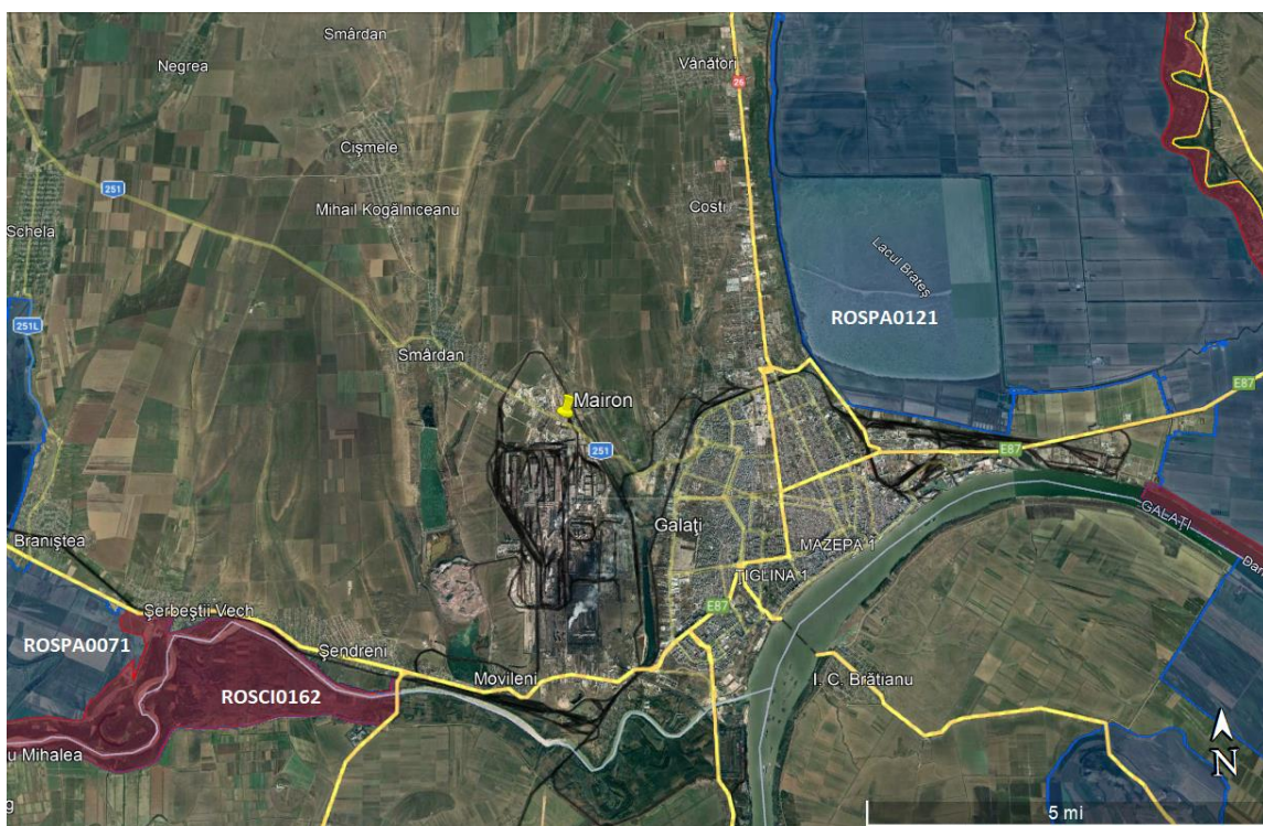
Figură 1: Distanțele față de ariile protejate

După cum se poate observa din figura de mai jos zona obiectivului este la distanță față de perimetrele ariilor naturale protejate, aproximativ 5.5 km față de situl ROSPA0121 Lacul Brateș și 6.4 km față de siturile: ROSCI0162 Lunca Siretului Inferior și ROSPA0071 Lunca Siretului Inferior. Natura lucrărilor efectuate în cadrul proiectului neavând vreo influență negativă asupra obiectivelor de conservare specifice ale acestora: habitate naturale, specii de floră și faună de interes comunitar.