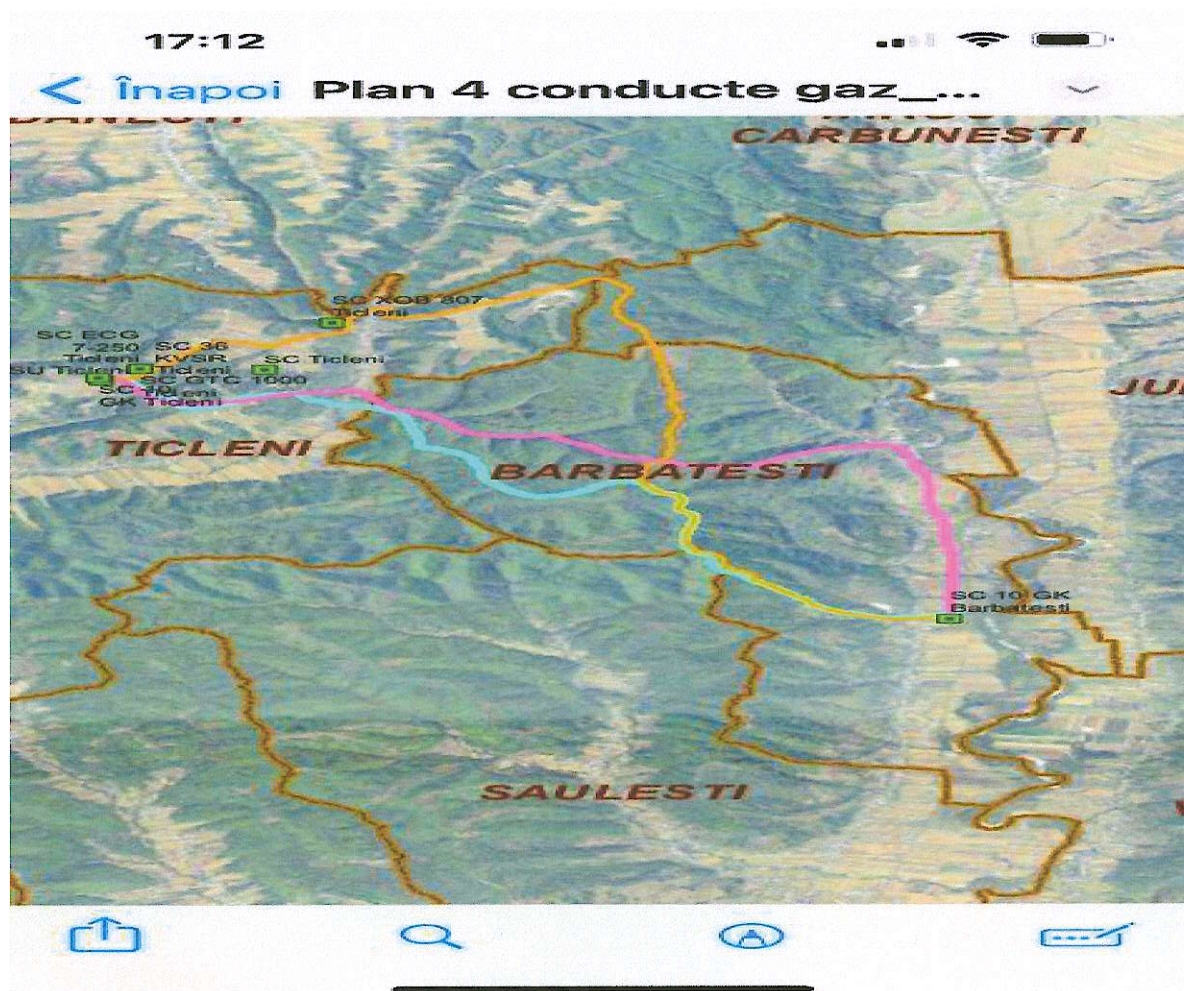
Figura 1: Plan de incadrare in zona