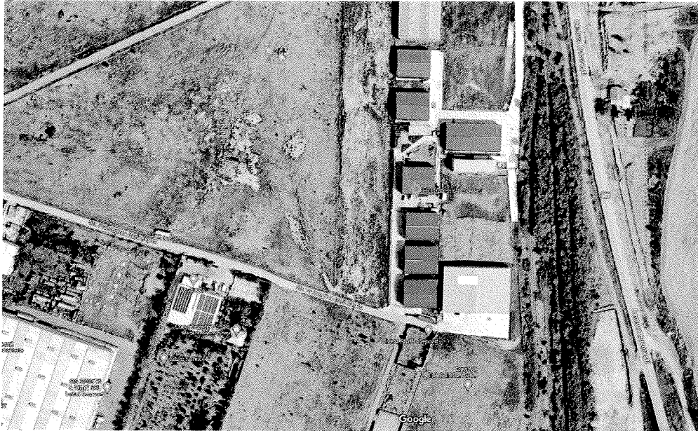
Figura nr. 2 Localizarea proiectului în cadrul amplasamentului