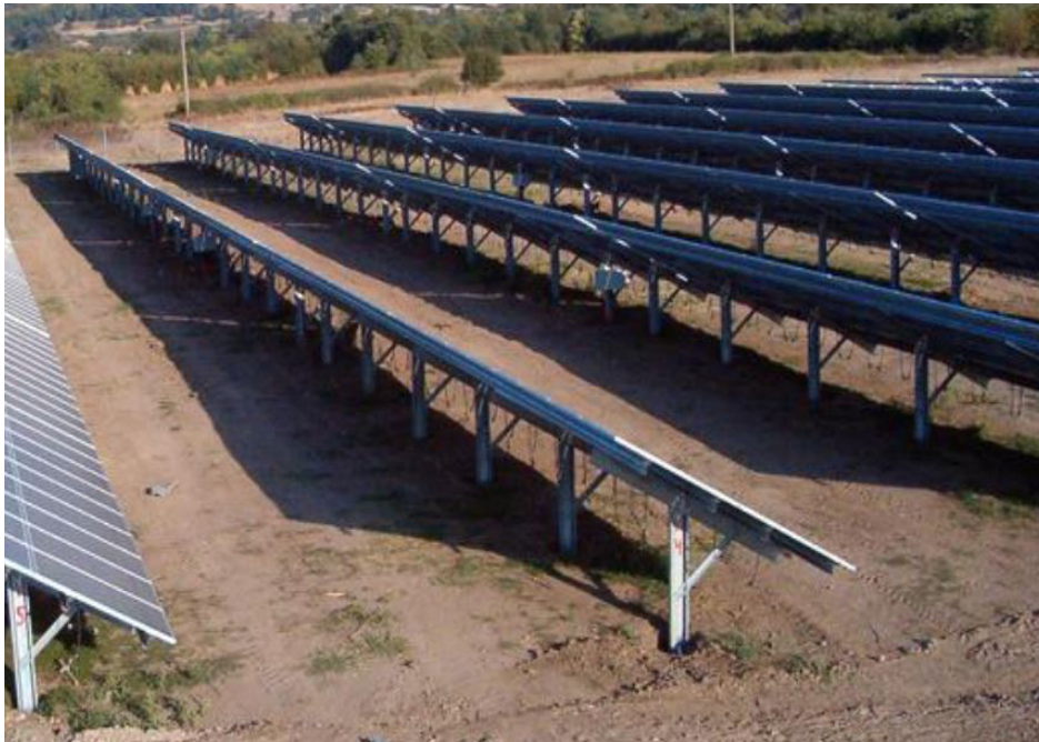
↑Reprezentare panouri montate pe sol