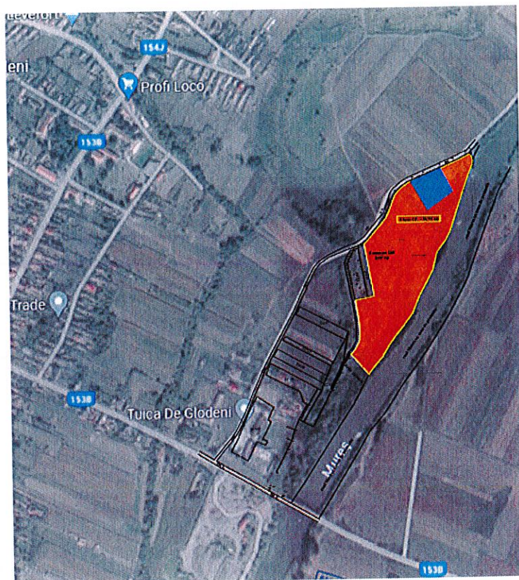
Plan de ansamblu

Conform extrasului de carte funciară nr. 52433 UAT Glodeni, folosința actuală a terenului de 34.113 mp este teren neproductiv.