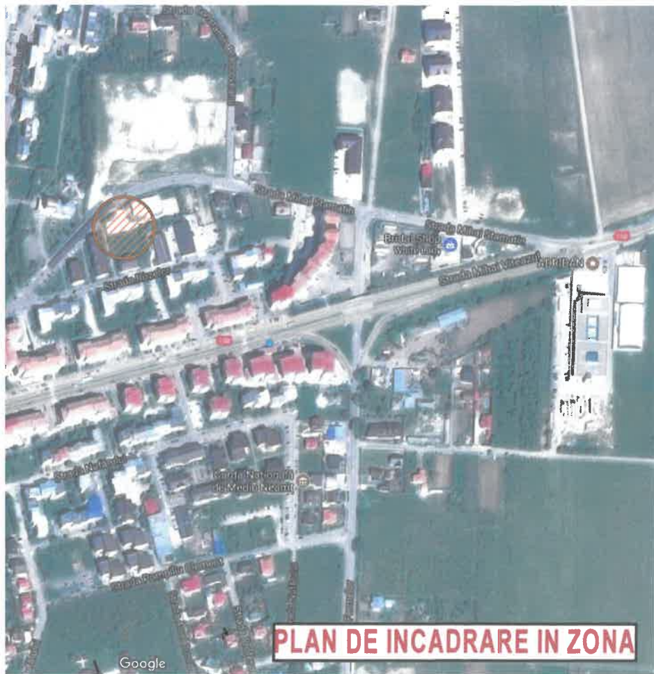
PLAN DE INCADRARE IN ZONA

teren = 3656,00 mp. constr. bloc locuinte propus = 519,15 mp. desf. bloc locuinte propus = 3395,05 mp. din care S demisol = 515,55 mp. S tot. logii+podeste = 230,92 mp. tot. utila bloc locuinte propus = 2619,28 mp. tot. locuibila bloc locuinte propus = 1334,73 mp. constr. existenta (constructie pastrata C1) = 522,00 mp. desf. existenta (constructie pastrata C1) = 522,00 mp. tot. constr. rezultata = 1041,15 mp. tot. desf. rezultata = 3917,05 mp. din care S demisol = 515,55 mp. .O.T. propus = 28,47% !U.T. propus (inclusiv demisol si logii) = 1,07