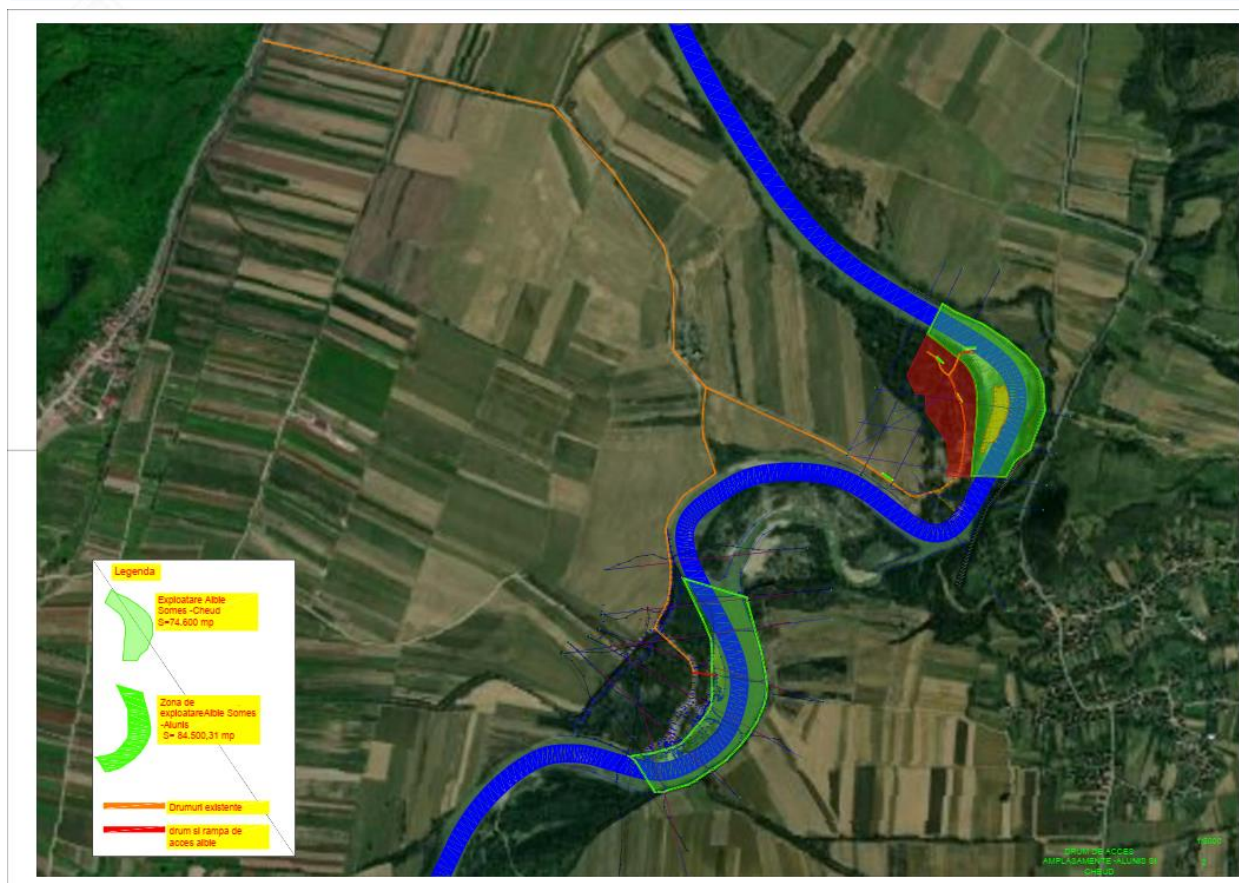
Figura 3 Accesul la perimetrul de exploatare