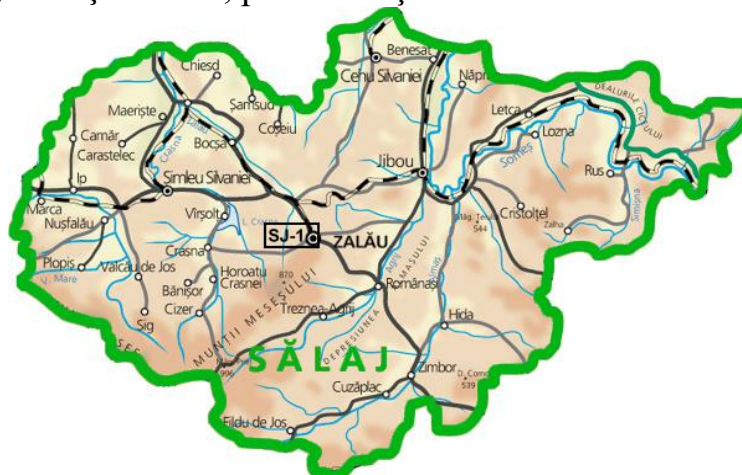
Fig. 1.1 Amplasarea stației de monitorizare a calității aerului, în județul Sălaj.

Calitatea aerului este monitorizată și prin măsurători continue în stația automată de tip fond urban, amplasată pe strada Meteorologiei. Poluanții monitorizați sunt: SO 2 , NO x , CO, O 3 , PM 10 , PM 2,5 alături de parametrii meteo: temperatura, direcția și viteza vântului, radiația solară, presiunea și umiditatea atmosferică.