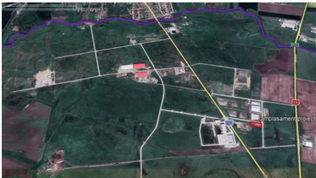
Figura 17.3. Evoluția antropizării PUZ-ului în care este situat proiectul (imagine Google Earth august 2021)