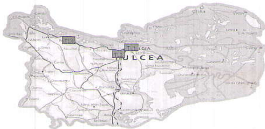
Amplasarea stațiilor de monitorizare în județul Tulcea

Prezentăm mai jos evoluția indicelui general de calitate a aerului din rețeaua locală de monitorizare a calității aerului