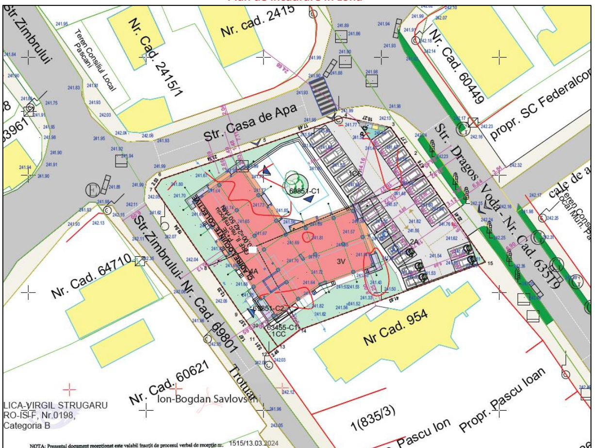
Extras din planul de amplasament