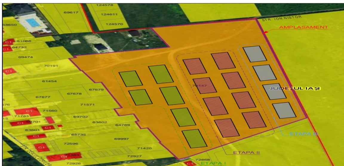
Amplasamentul propus pentru realizarea proiectului

Conform prevederilor Certificatelor de Urbanism nr.189; nr.190; nr. 191; nr. 192; nr. 193 și nr. 194 din data de 23.06. 2023 emise de Primăria Comunei Rediu, județul Iași , terenul propus pentru realizarea proiectului este situat în intravilanul comunei Rediu conform PUZ aprobat prin HCL Rediu nr. 50/06.06.2022.