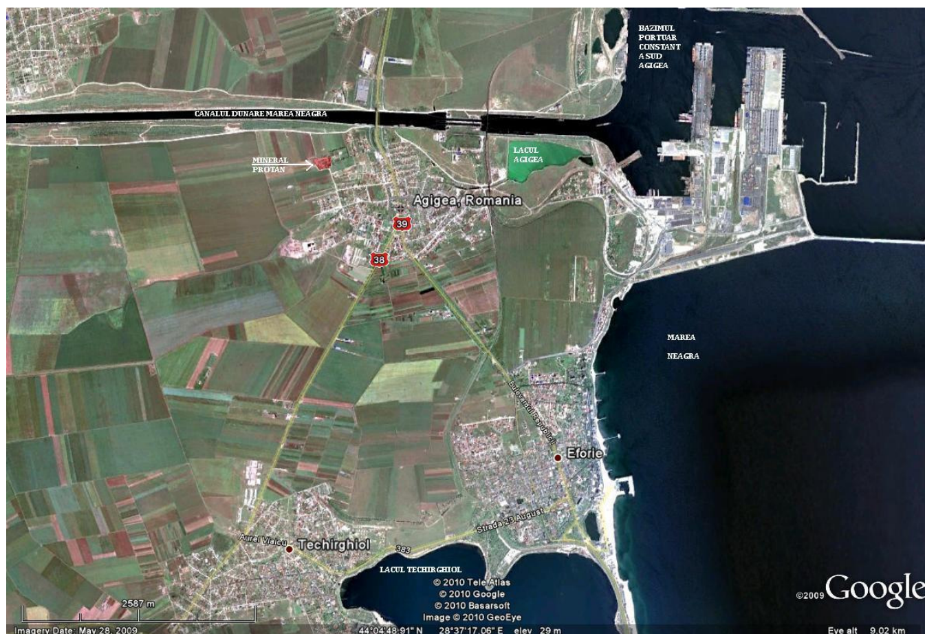
Fig. nr.2 :localizarea celor mai apropiate corpuri de apa de suprafata in raport cu obiectivul analizat

Marea Neagra este o mare semiinchisa, componenta a Marii Mediterane, de al carui bazin se leaga prin mai multe stramtori si bazine: stramtoarea Bosfor, Marea Marmara, Stramtoarea Dardanele si Marea Egee.