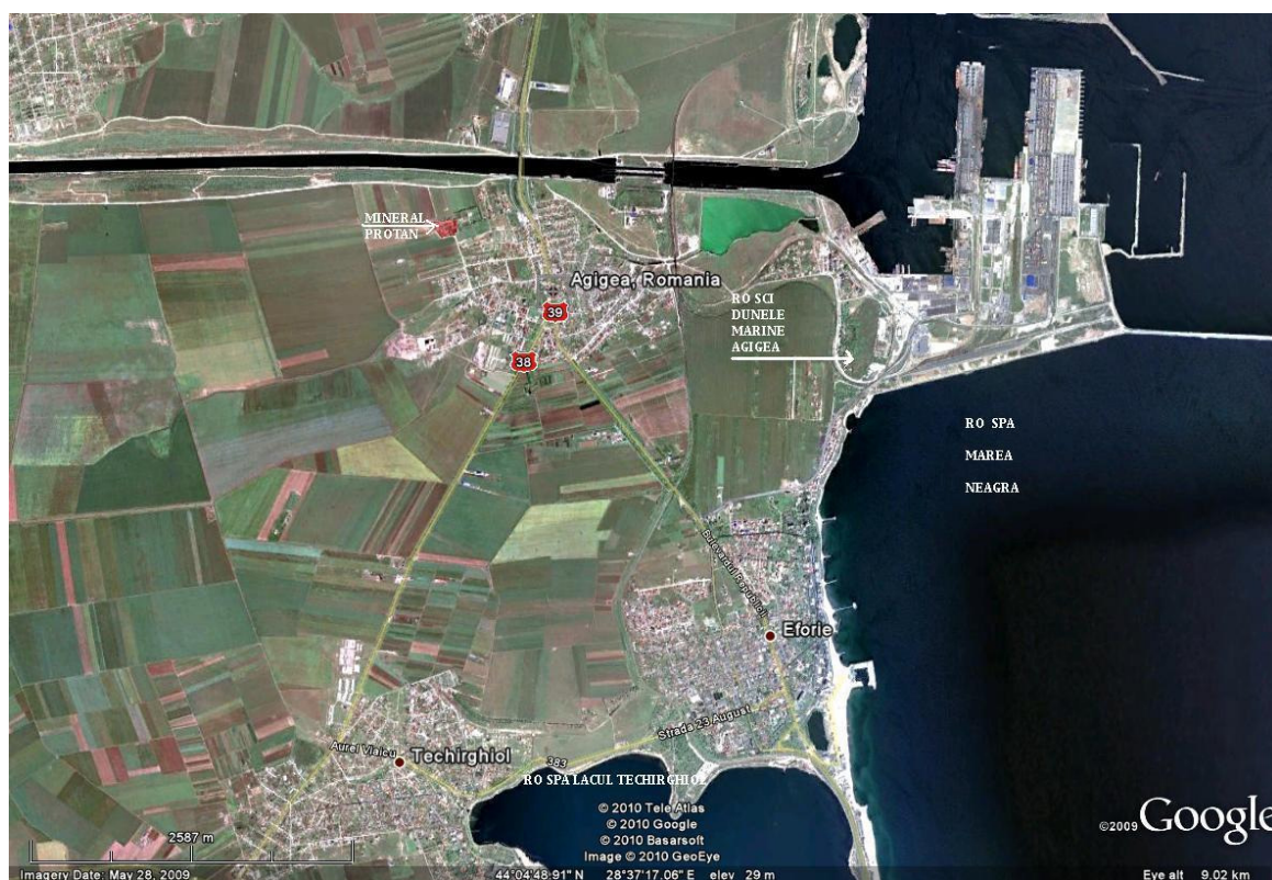
Fig. nr. 4 : amplasarea obiectivului in raport cu ariile naturale protejate din zona