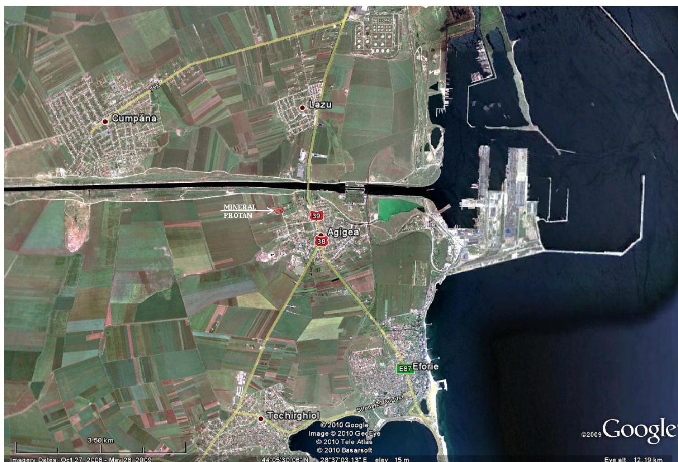
Fig. nr.1: vedere de ansamblu a zonei în care este situată MINERAL PROTAN AGIGEA S.A.